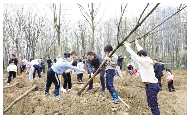
3月12日,二百多名师生共同植下三角枫、榉树等乡土树种一百余棵,为东湖校区又增添了一抹浓绿。