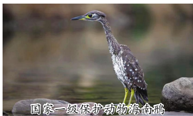
国家一级保护动物海南鵲

1月23日,开化县何田乡村民在田边劳作时发现一只国家一级保护动物海南鵲,这已是开化第三次发现海南鵲。海南鵲属全世界30种最濒危的鸟类之一,被称为“世界上