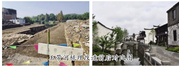
玉带河梳理改造前后对比图

通过河道治理,内河调蓄能力得到提升,水体污染消纳能力增强,水质由劣V类提升到Ⅲ类,鱼类和虾贝类等水生生物量逐渐增加。当地游客量比2019年增加了22%,业态激活后,给当地的居民提供了大量的就业机会。