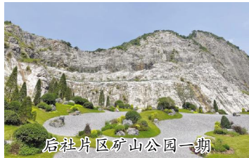
后社片区矿山公园一期

2018年,常山县关停拆除16家轻钙企业、165孔石灰土窑和201条石灰钙生产线。实施垦造耕地项目,垦造水田735亩,“旱改水”180亩,建设用地复垦1245亩,新增了大量集中连片优质耕地。同时,对矿采区域开展了“一区一策”治理修复,打造“矿山地质公园”,整个区域形成合理的生产、生态、生活空间划分。