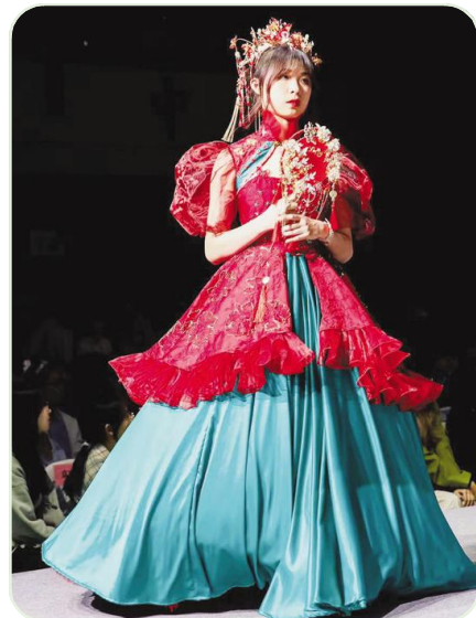
服装与服饰设计专业“Z视界”2023届校园生态服装秀